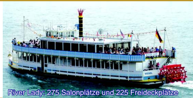
River Lady: 275 Salonplätze und 225 Freideckplätze