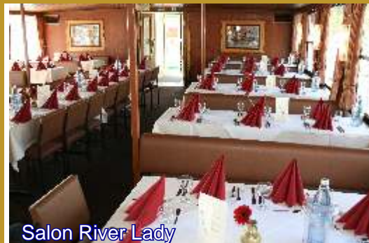
Salon River Lady

Information, Reservierung & Geschenkgutscheine: